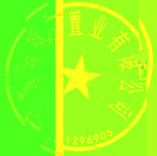
表 袋密 封件